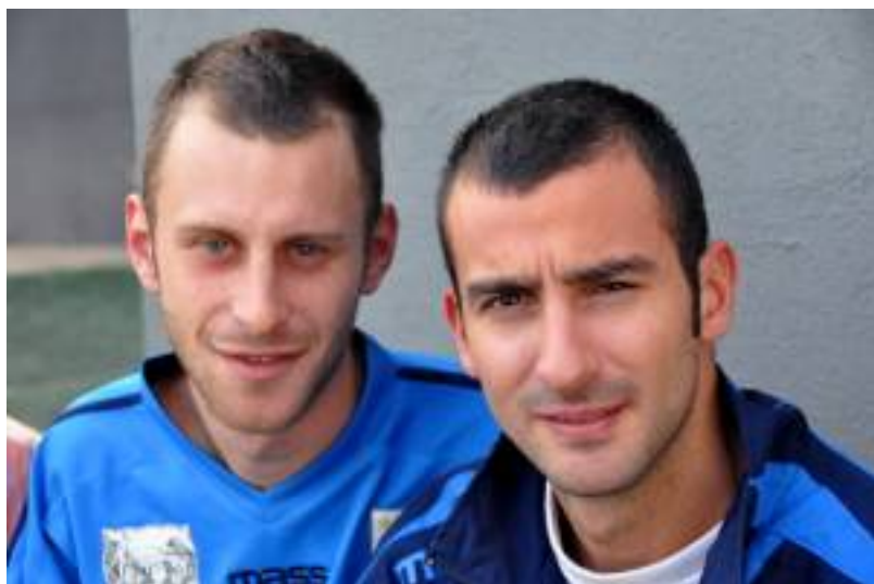
Rosco e Sberla autori di 3 gol