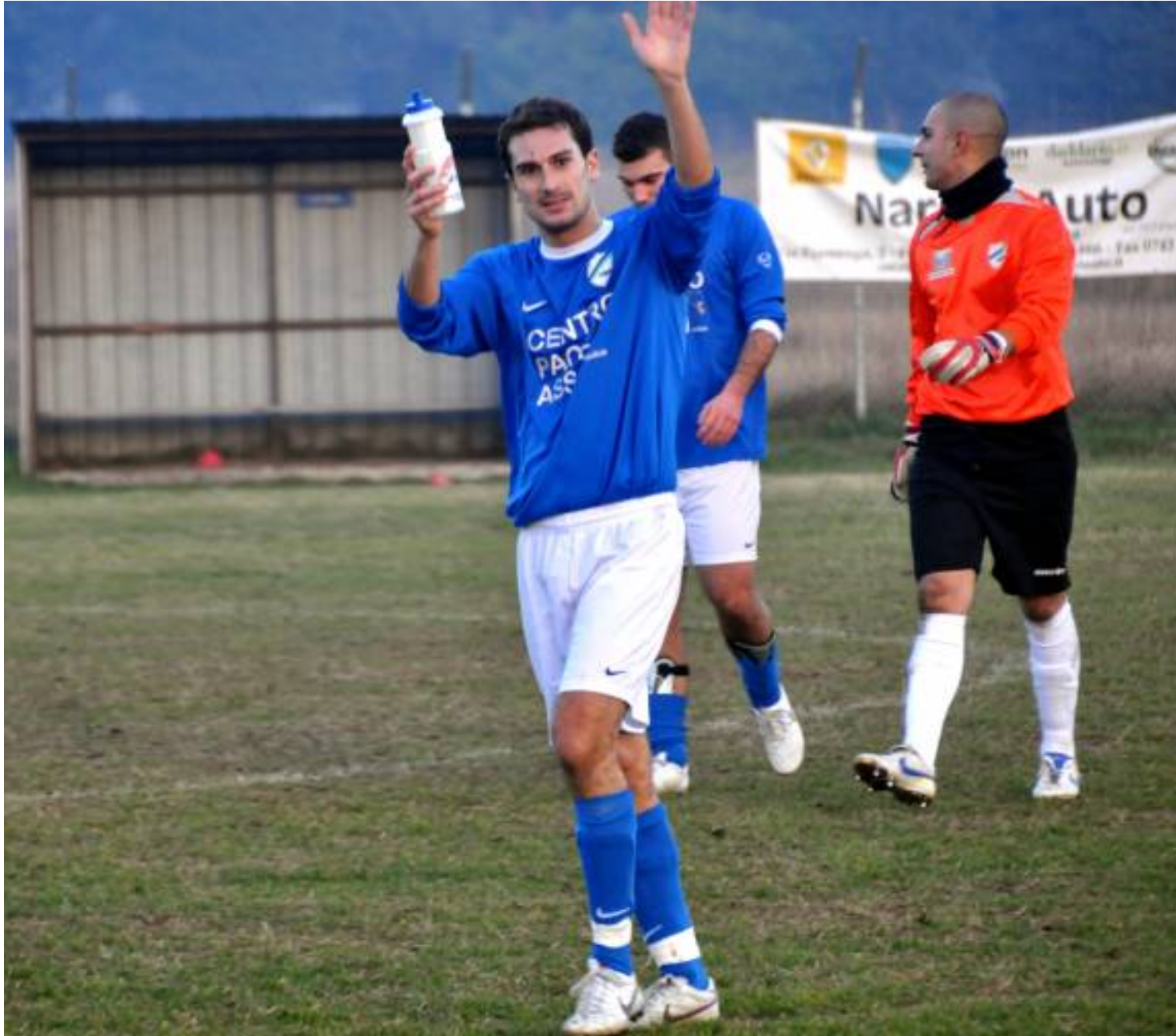
Ciani saluta a fine partita