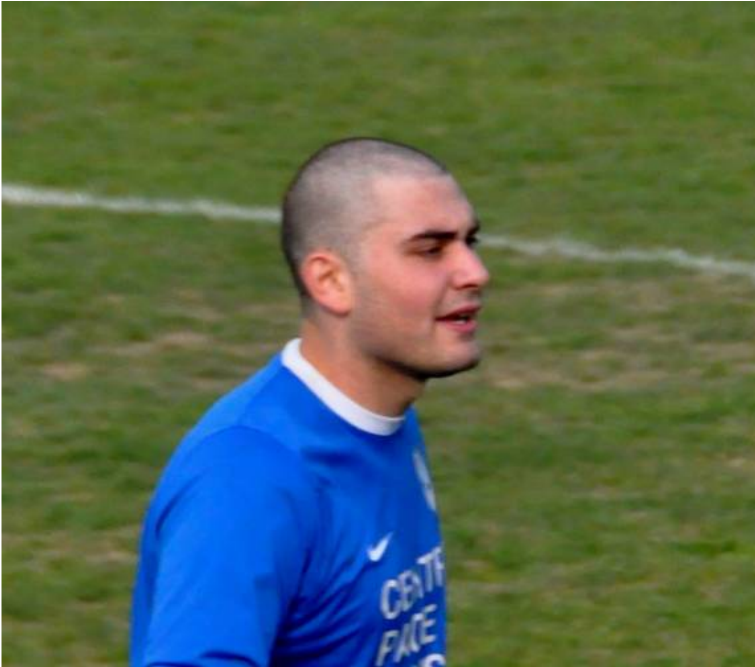
Loretone, autore del primo gol su punizione