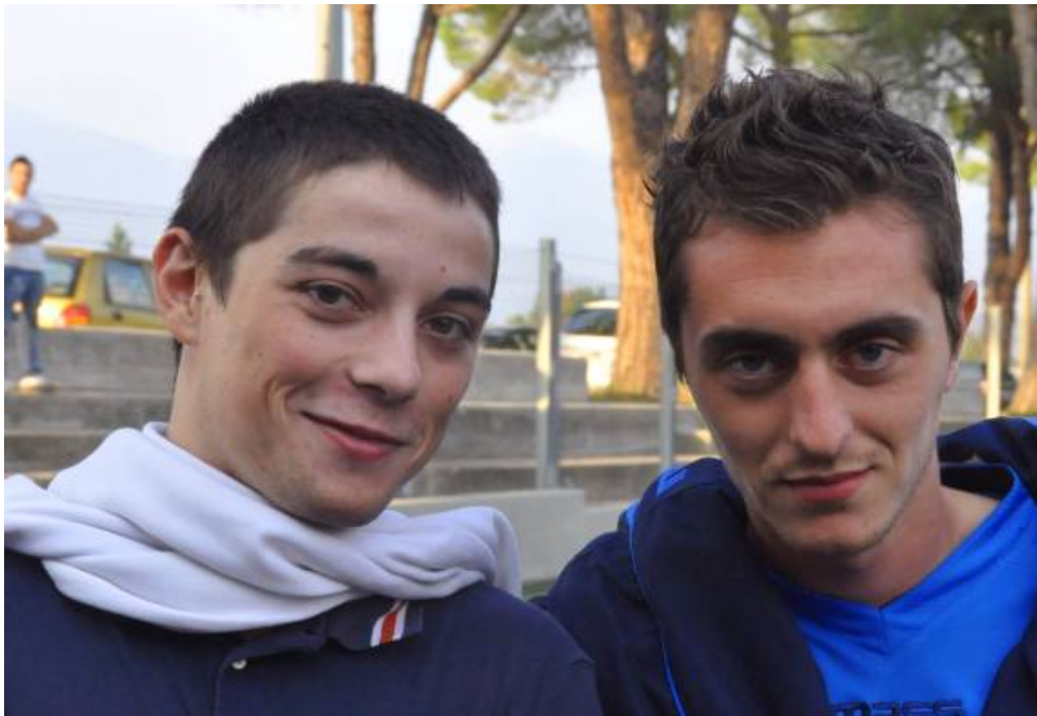
Campi e Papa