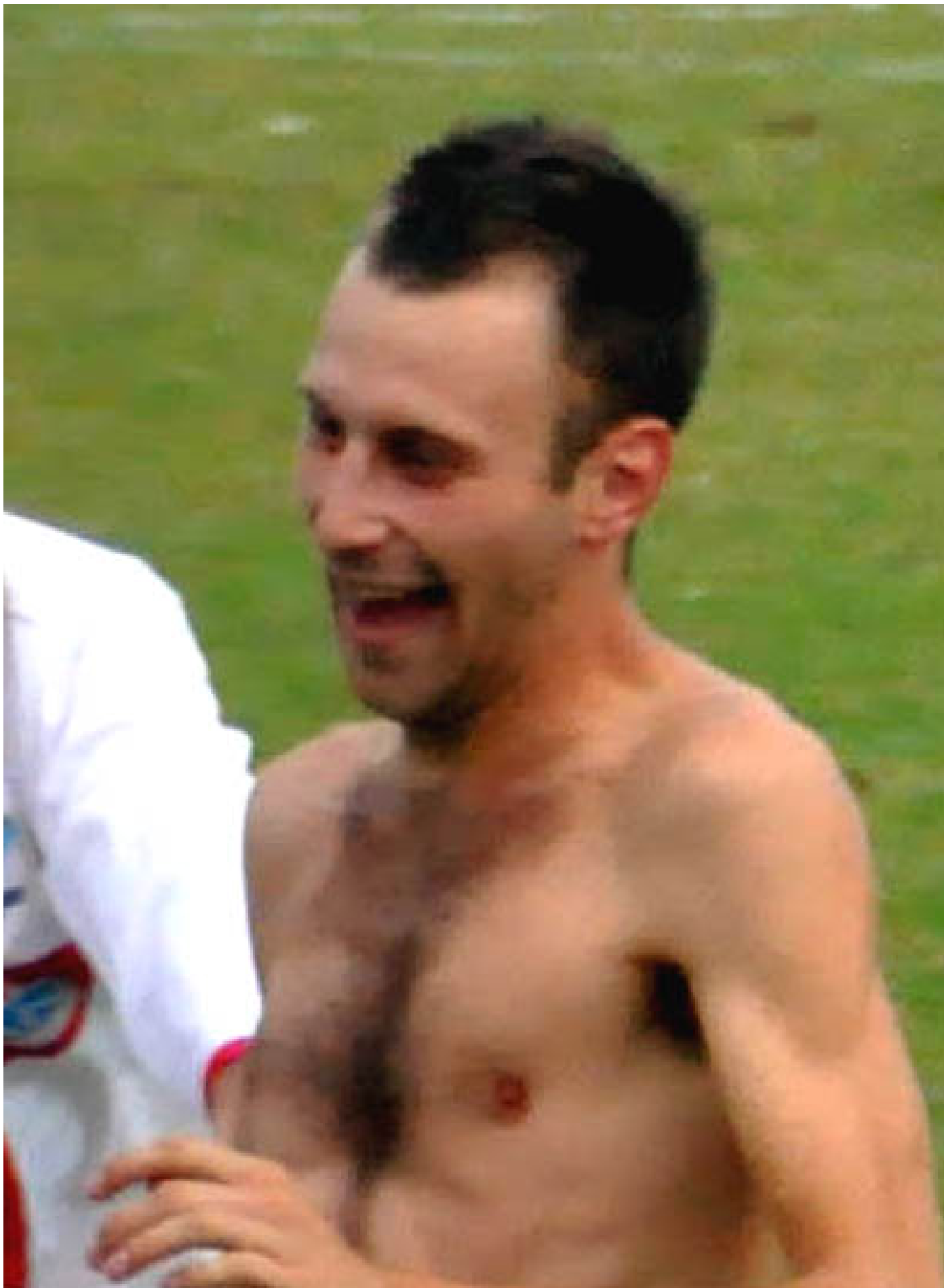
Dedicato ad Alice